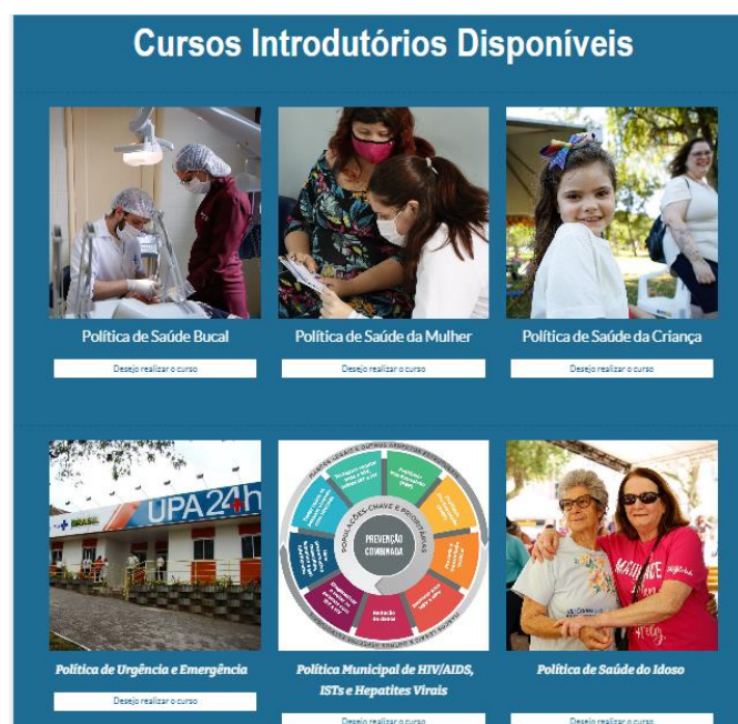
Imagem 1: Segmento dos cursos ofertados na plataforma do curso introdutório.

Para realizar alterações ou novas contribuições, é preciso acessar o e-mail do NEPeS de Santa Maria, em seguida, deverá direcionar-se para o Google Drive, onde haverá uma pasta nomeada “Curso introdutório” encontrando o site nomeado “Curso introdutório SMS”. Outras duas pastas também estão incluídas, nomeadas como “Formulários/inscrições cursos introdutórios”, “cursos introdutórios” e “material de apoio”.