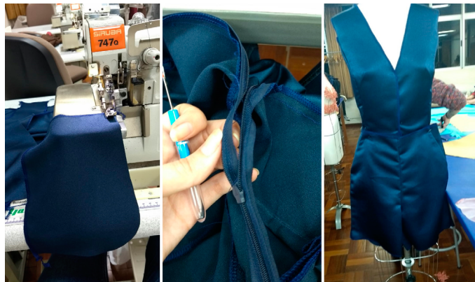
Figura 2 – Processos de costura (peça desenvolvida para o desfile Fashion Première, aluna Leticia Freitas).

Nossa parceira de viagem, a piloteira , que é uma costureira muito experiente e polivalente, preocupa-se, além de montar a peça, comunicar aos colegas os processos de costura e acabamento que possam facilitar ou otimizar a produção do modelo em montagem (Figura 2).